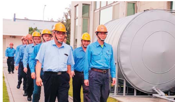
高層帶領全員參與【動次動次~你動我動】