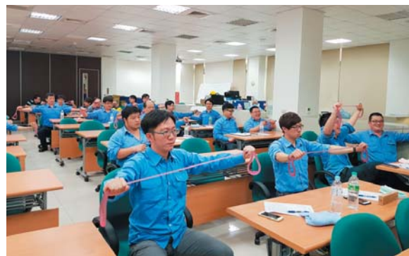
員眷親子健走踏青，促進情感交流