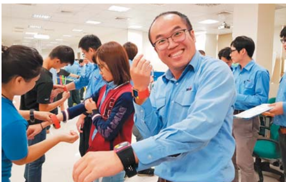
推動全員皆可參與簡易【動次動次】活動

展望未來將延續 2018 年之精隨下修競賽基準並加入影響【健康危險因子】權重為輔，推展複合式優化活動；並持續推展【相似族群】共同競賽提升活動【涵蓋率】，進而達最終目標以【小質化】帶動【大量化】，耕深健康促進友善文化。