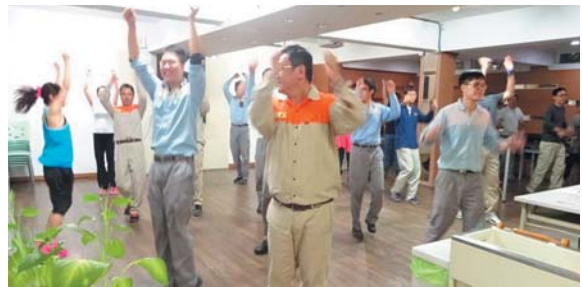
有氧運動~消除體脂肪